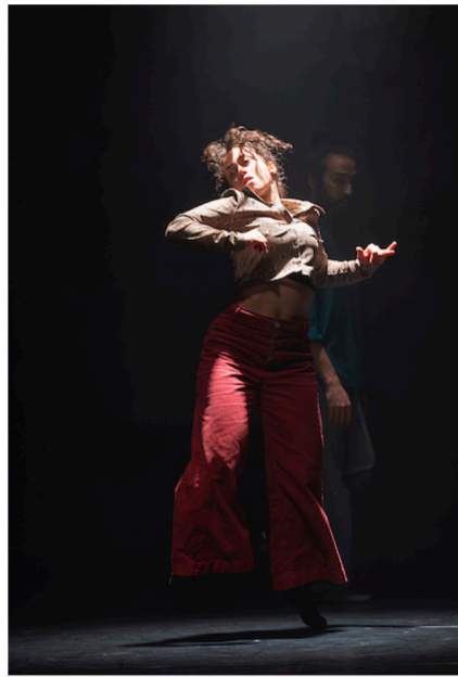
"Enso-Boléro" de Mickael Le Mer

Tout commence par la main d'une danseuse qui prend la lumière comme un poisson nage dans un rayon de soleil. Dans la pénombre, elle trace des lignes invisibles, comme une écriture en suspens, esquissant une matière originelle, une humanité en train de se façonner, avant de déployer une gestuelle singulière, mélange d'extrême souplesse et de locking, avec des cambrés renversants. Si la référence au pinceau lumineux qui nimbe le premier bras levé dans le Boléro de Bédart est réelle, celle-ci joue plutôt comme un clin d'œil pour initiés.