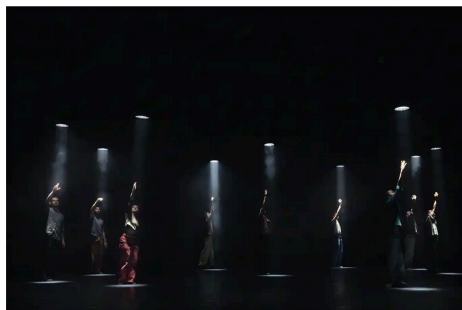
Enso – Boléro de Mickaël Le Mer

Le cercle est ainsi la figure centrale que décline en permanence Enso – Boléro , largement appuyée par une machinerie de projecteurs en mouvement avec ses « douches » lumineuses s'élargissant à volonté et dans lesquelles, et autour desquelles, les neuf interprètes prennent place, entre ombre et lumière. Les projecteurs jouent ainsi leur partition chorégraphique pour accompagner celle des interprètes, variant leur hauteur, sculptant l'espace et les corps en permanence.