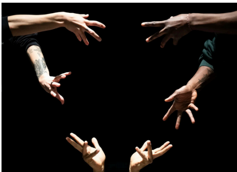
Enso © Thomas Badreau

Lorsque le Boléro de Ravel retentit, des puits individuels isolent et magnifient les danseurs, donnant une impression d'apesanteur et de poésie aérienne. Les silhouettes virevoltent, suspendues avec légèreté et fluidité, comme des étoiles dans un ciel en mouvement. L'effet est onirique et réjouissant. On ressent un apaisement profond et une joie contenue dans la liberté des mouvements.